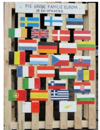
Heinz-Dieter Wallace Die "Großfamilie"- Europa