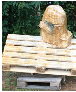
Ulla Steinwachs Freude Schöner Götterfunken