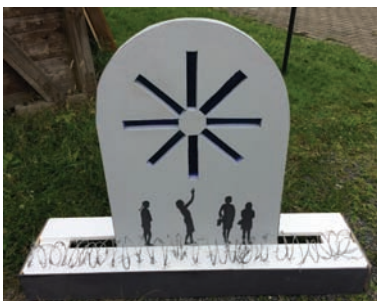
Brigitte Altenhof Europa?