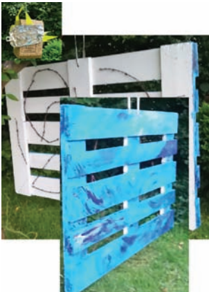
Sabine Schlemmer Kind of ... blue