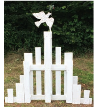
Erika C. Koch Ob Kathedrale, Moschee oder Synagoge - Friede über Europa