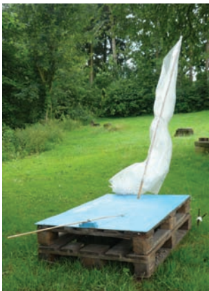
Manja Dessel Quo Vadis?