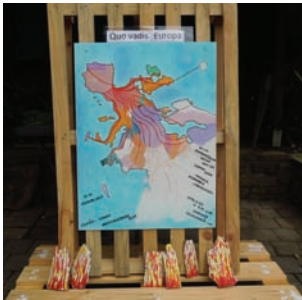
Elke Wallace Quo vadis Europa?