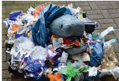
Hanna Ludwig-Schmidhuber - Der Weg?? - Die Wahrheit?? - Das Leben!!